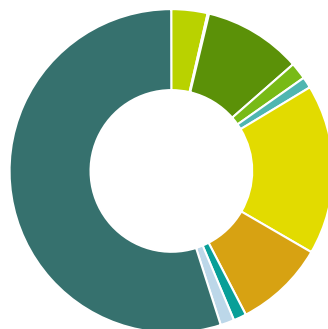
Bat en per programma